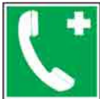
Telefono di emergenza