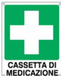
Cassetta di medicazione