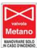
Valvola di interruzione gas Metano