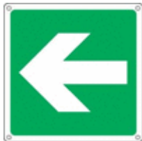
Percorso di emergenza