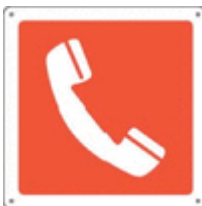
Telefono di emergenza antincendio