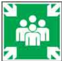
Punto di raccolta